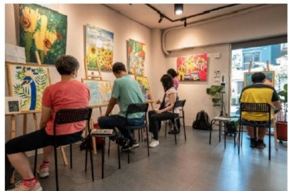
圖二為改建後美術空間及畫展實況。