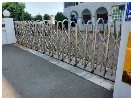
▲院區自動伸縮大門