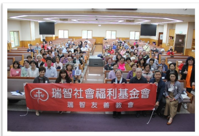
3/19 瑞智友善社區研習會 (台北場)

使更多的社會大眾正確地認識失智症，願意接納、支持、幫助及陪伴失智者和其家庭，使他們在困難中有盼望，提升生活品質與尊嚴。