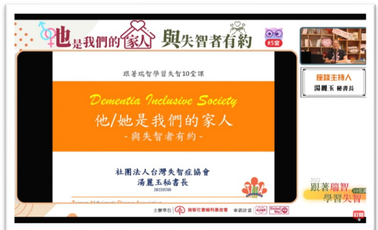
7/9 「跟著瑞智學習失智 10 堂課」#5