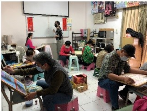
圖一為改建前美術教室。