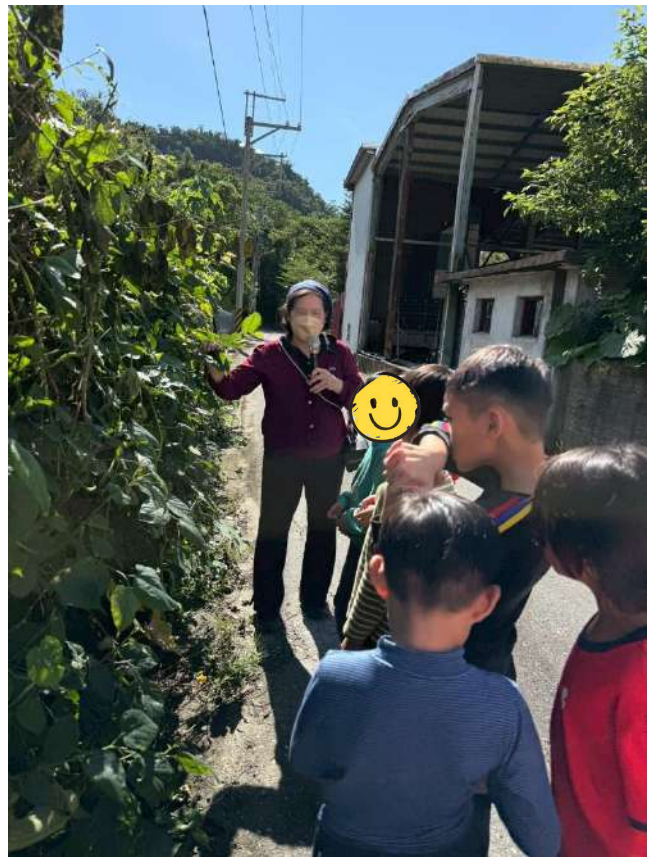
【部落文化手作課】園藝輔療