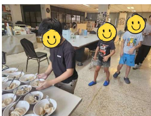
課輔班水餃點心時間