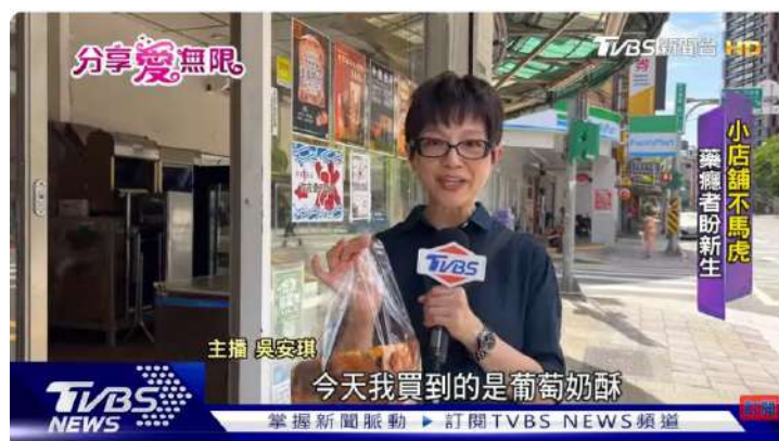
打破惡性循環 利伯他茲助藥癮者重建人生 | TVBS新聞 @TVBSNEWS01