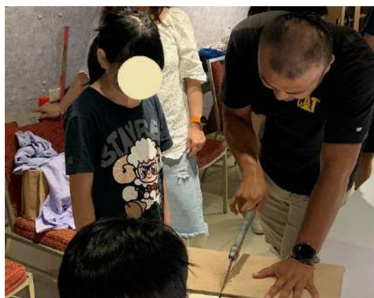
辦理小職人體驗課程