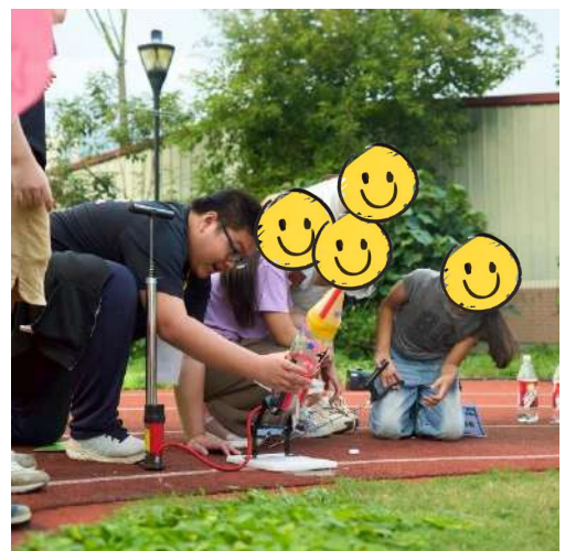
勵友中心好 young 少年創意基地【營隊服務】