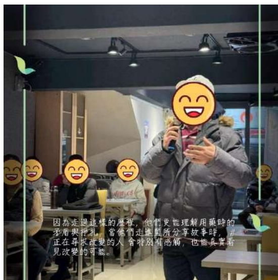
種子教師集合分享