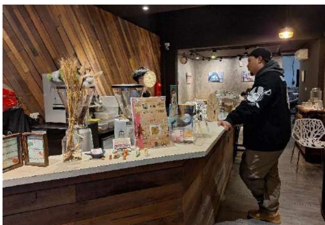
在社企咖啡廳的青少年服務

成立「七品聚圓夢餐廳」、「心聚點人文咖啡小棧」和「九個菓子銷售工作坊」、「九菓烘焙坊」、「五餅二魚古早味」、「茁牧物業管理中心-修繕特工隊」等社企場域，以提供藥癮更生人及司法少年，尤其受有毒品危害之虞青少年就業及職訓機會。