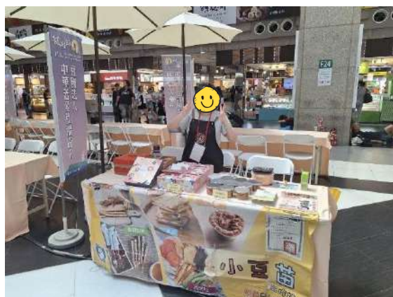
小豆苗工作坊參加 114 年度身障秋節產品聯合推廣活動

3. 服務人數：依與政府簽訂服務契約，本單位可服務容納 15 名身心障礙者。近三年平均服務人數為每年每月固定 15 人、每年平均服務人次為 3272.6 人次。