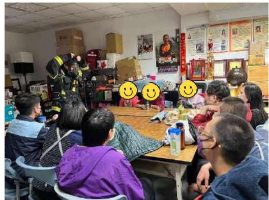
小豆苗工作坊學員參訪消防局實地消防演練