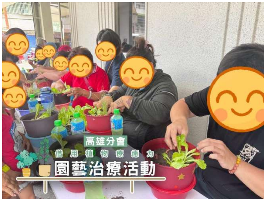
高雄分會園藝治療活動

結合鄰近天主教木柵復活堂永安長青文康小站，藉一系列多元化的文康休閒活動，以及共餐、送餐及電話問安、關懷訪視等項目服務，以鼓勵長輩們增加社會參與度。