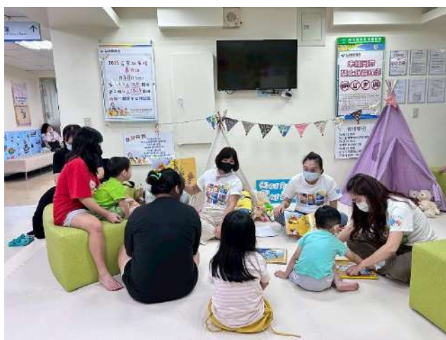
【青草地故事繪】新勢公園、桃園醫院