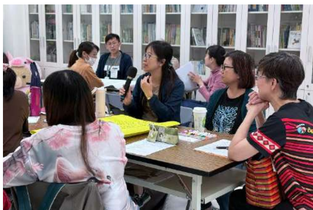
【生命園丁】生命教育初階培訓