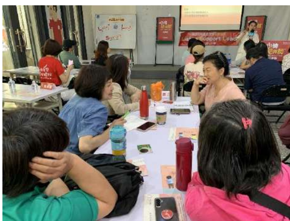
心情陪伴師【工作坊】