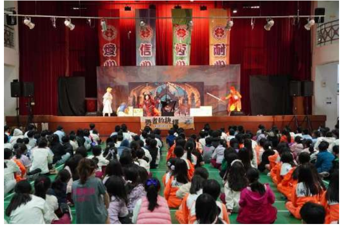
【反毒公益舞台劇】「勇者的抉擇」