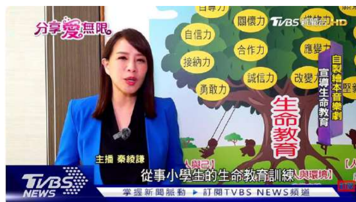
彩虹愛家守護「心貧兒」生命教育陪伴成長 | TVBS新聞 @TVBSNEWS01