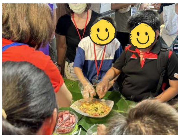
食農教育【小農星球】