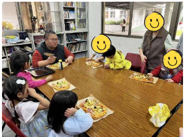
幼稚園親子烘焙日