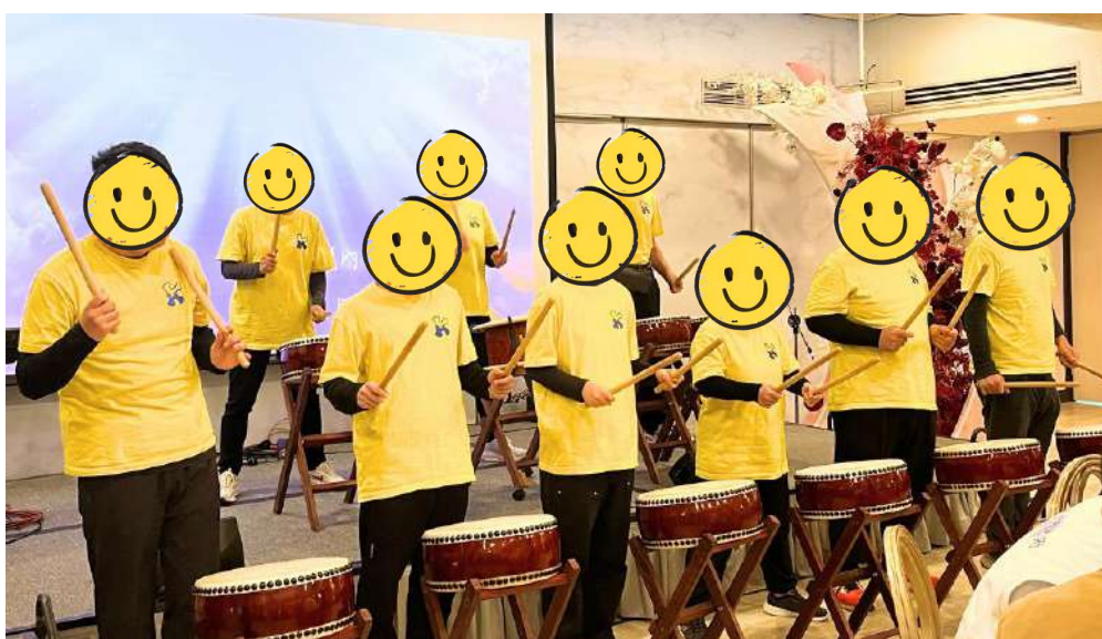
龍潭肯納園親子太鼓隊表演【TVBS 新北愛無限公益餐會】