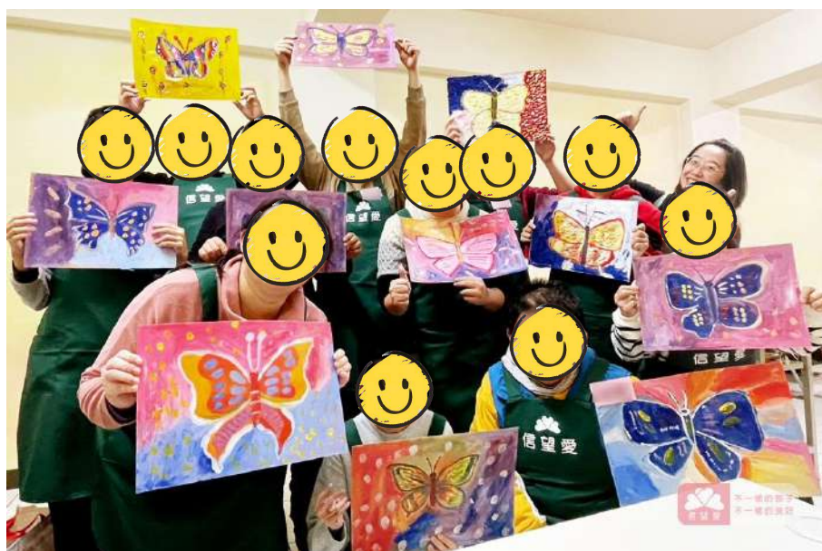
沙鹿小作所青年美術繪畫