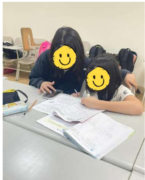
陪讀班學生寫作業時間