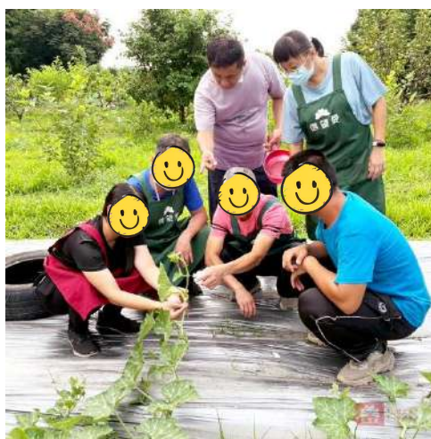
【種南瓜】食農教育活動