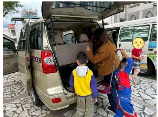
陪讀班學生打掃接送娃娃車