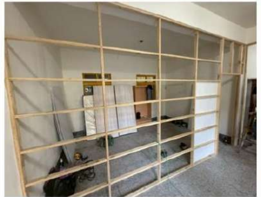
修繕中(屋內輕隔間)