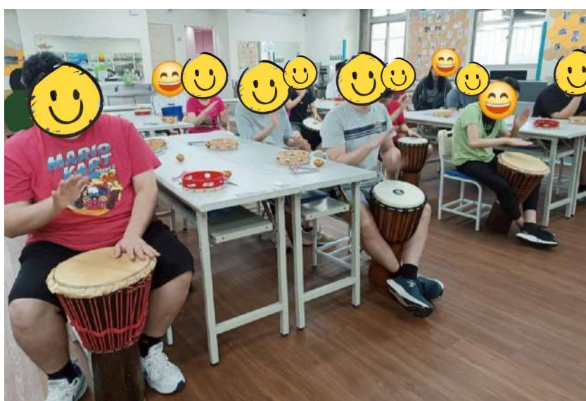
肯納青年鼓樂課程