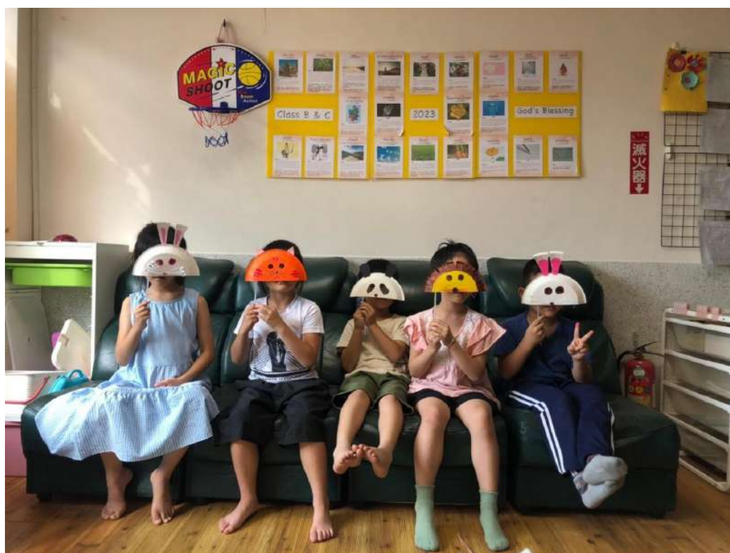
品格班手作動物面具