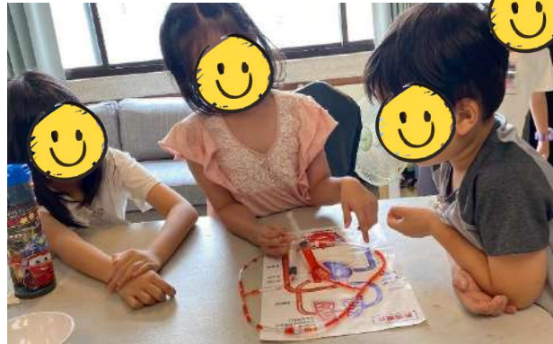
【細胞探測艦暑期營隊】透過遊戲認識身體器官及免疫力系統