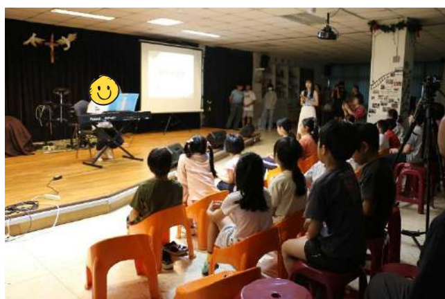
2025 谷中兒少成果發表會