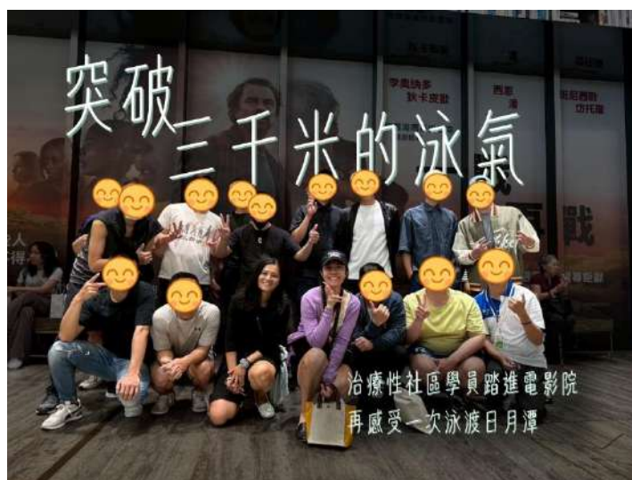
帶藥癮治療性社區學員泳渡日月潭、觀賞電影