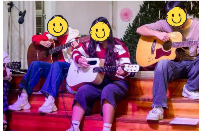
臺灣蒙恩的孩子教育協會才藝成果發表活動