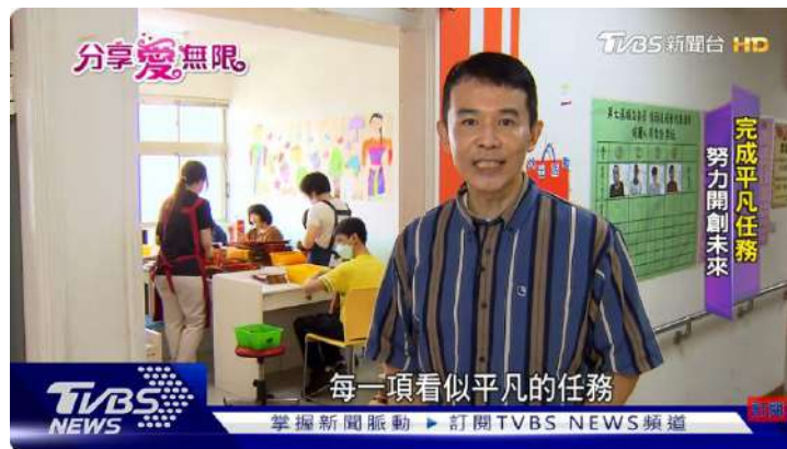
不一樣的孩子 不一樣的美好 信望愛陪伴成長 | TVBS新聞 @TVBSNEWS01