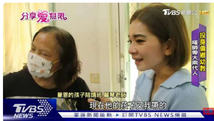
守護偏鄉兒童「蒙恩的孩子」盼教育不設限 | TVBS新聞 @TVBSNEWS01