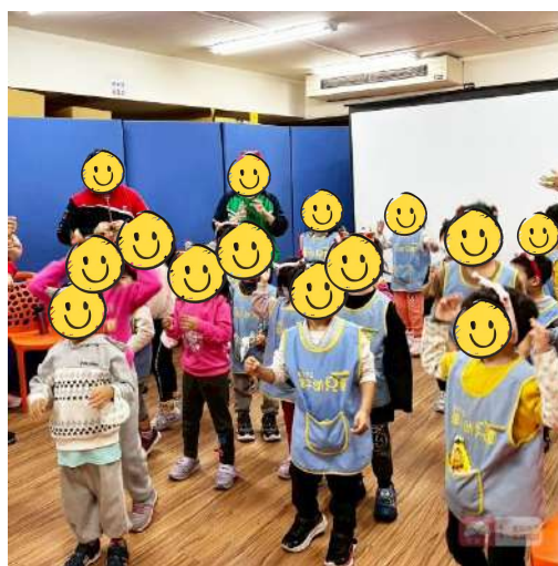
幼兒園師生來訪【聖誕聯歡】