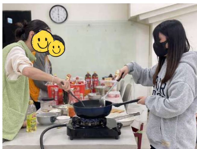
陪讀班學生晚餐時間