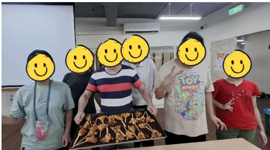
肯納健康工坊【萬聖節女巫掃把派手工活動】